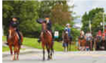
Crédit photo - Festival l'Esprit de Potton : Claude Bouchard Crédit photo - Cérémonie d'illumination du sapin de Noël : Émilie Hébert-Larue

Samedi 26 septembre Dégustations incluant la fabrication du cidre et un concours de tartes aux pommes.