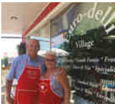
Euro-Delli du Village

Resto-Bar MTN HAUS et Cafétéria (pour déjeuners et lunchs) Station de ski Owl's Head 40, chemin du Mont Owl's Head Township of Potton QC J0E 1X0 450 292-3342 / 1 800 363-3342 services@owlshead.com owlshead.com * Ouvert pendant la saison de ski, n'oubliez pas de réserver.